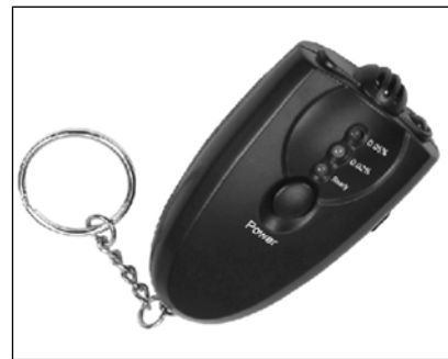
Alkotest za pet evrov je igračka, ki je detektiv ne more uporabiti za resno delo.

Neutemeljene so pritožbene navedbe, da je imel tožnik opravičljiv razlog za zavrnitev preizkusa z alkotestom, ker naj bi alkoholiziranost na delovnem mestu lahko ugotavljal le strokovno usposobljen delavec skladno s splošnim aktom delodajalca ali pogodbo o zaposlitvi. Že iz izpodbijane sodbe namreč izhaja, da vprašanje upravičenosti odklonitve preizkusa vinjenosti niti ni bistveno za odločitev. Sicer pa so pooblastila zasebnega detektiva urejena v 9. členu Zakona o detektivski dejavnosti (ZDD; Ur. l. RS, št. 32/094, 96/02 in 90/05). Informacije sme pridobivati neposredno od osebe, na katero se nanašajo, pa tudi od drugih oseb, ki imajo podatke in so jih pripravljene prostovoljno posredovati, med drugim o disciplinskih kršitvah in disciplinskih kršiteljih. Pri tem je potrebno upoštevati, da nima neomejenih možnosti glede nadzora nad de-