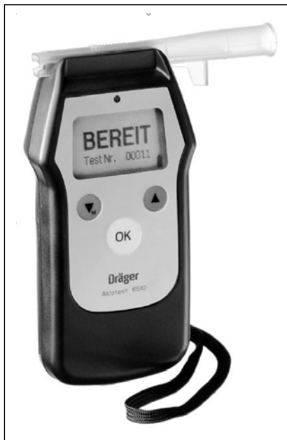
Profesionalni instrument za preizkus alkoholiziranosti.

Nadalje je zapisano, da »po določbi 1. odstavka 110. člena Zakona o delovnih razmerjih (ZDR; Ur. l. RS, št. 42/2002) lahko delodaja-