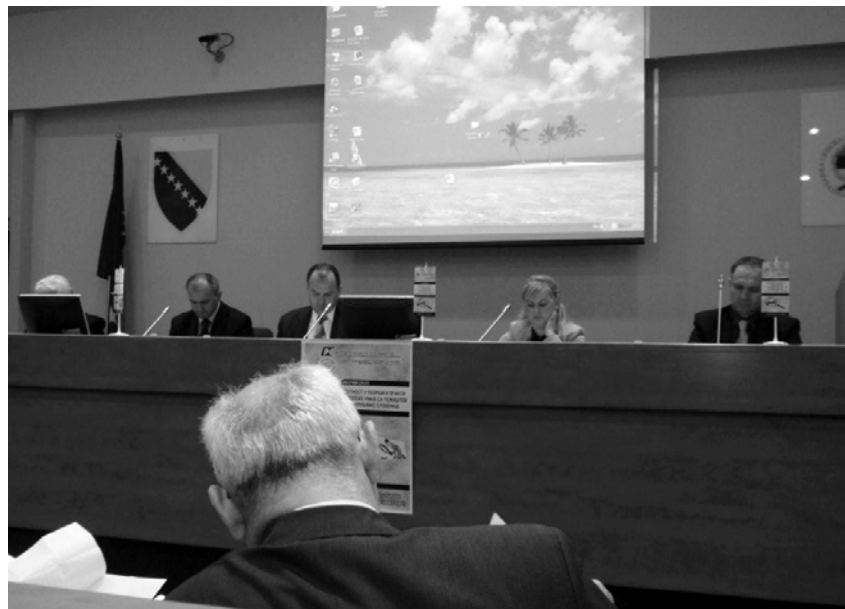
Podpis sporazuma med Republiko Srpsko - BiH in DeZRS.

Madžarske podpisali prvi Mednarodni sporazum o strokovnem sodelovanju in pospežitvi detektivske dejavnosti. Od takrat dalje smo se redno udeleževali njihovih kongresov, prav tako pa so se kolegi iz Madžarske večkrat udeležili naših sej UO, kjer smo izmenjali strokovne izkušnje. V